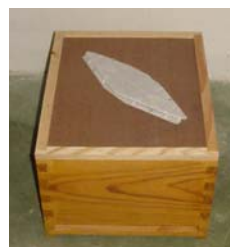
Detalle escape rombo

Venga a informarse, consultemos sin compromiso, les atenderemos en: