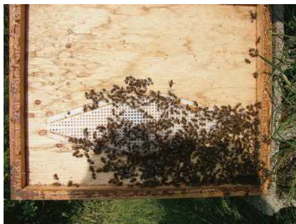
Aquí vemos como después de un rato si levantamos el contratape se produce una acumulación de abejas que han bajado del alza a la cámara de cría e intentan subir al alza pero el escape se lo impide.