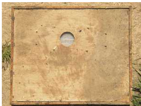
Vista superior, es el lado por donde entran las abejas del alza a la cámara de cría. Esta es la posición que debemos ver contratape encima de la cámara de cría de la colmena. Después colocamos el alza

Se Utilizan sobre todo en colmenas langstroth y dadant (colmenas de alzas), pidiendo se utilizar también en colmenas layens de alza. Esta fabricado en plástico y sirve para que las abejas abandonen las alzas, Se coloca en un tablero o contratape tal y como vemos en la foto. El tablero se coloca entre la cámara de cría y el alza o alzas que queremos que abandonen las abejas. Ponga un escape de abejas entre la cámara de cría y el cuerpo de miel el día antes de la recogida (al atardecer) y todas las abejas estarán en la parte de abajo de la colmena a la mañana siguiente.