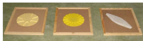
Otros tipos de escapes

Miel Valle de los Pedroches TODO TIPO DE MATERIAL Y MAQUINARIA APICOLA. SANTO DOMINGO Nº 29; Tel. 637302517 www.mieldelvalledelospedroches.com mieldelvalledelospedroches@hotmail.com 14400 POZOBLANCO (Córdoba) España