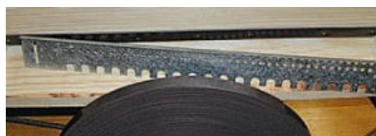
FIJACION POR BANDA MAGNETICA

Venga a informarse, consultemos sin compromiso, les atenderemos en: